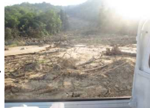
【西日本豪雨による土砂崩れ】