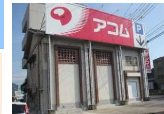
【完成】海田アコム店 基礎補強工事(下野)