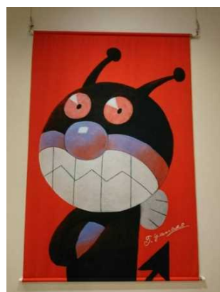
★バイキンマン★ キャラクターは2,000を超える

どんな時代にも希望はある。 (参考図書:「何のために生まれてきたの?」 やなせたかし著)