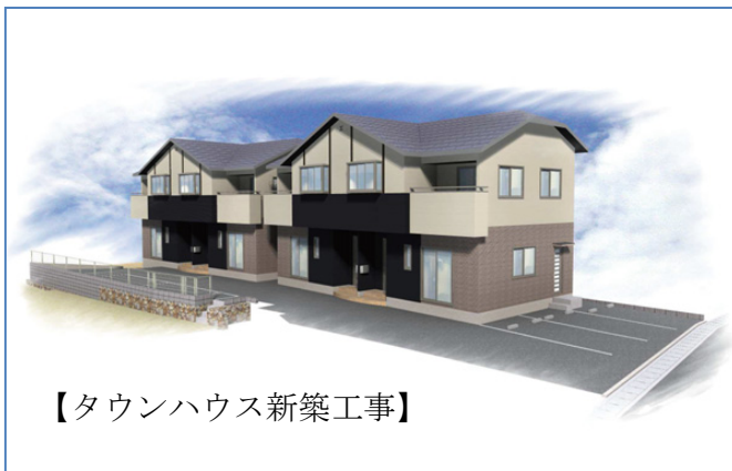
【タウンハウス新築工事】