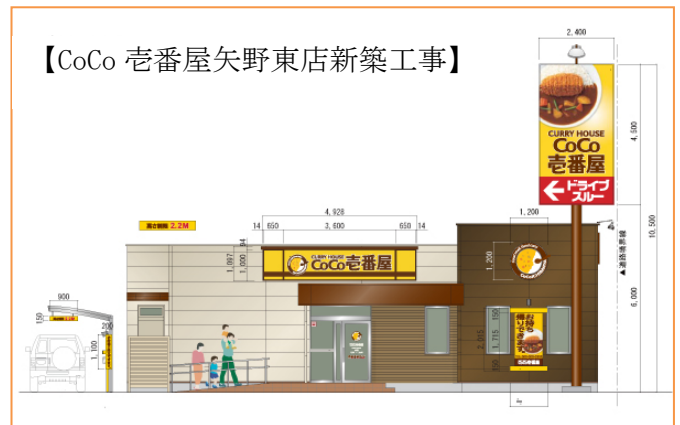
【CoCo 壱番屋矢野東店新築工事】